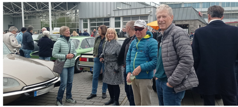
Saisoneröffnung im Museum „Central Garage“ in Bad Homburg